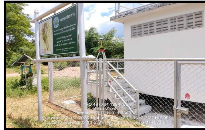
ทิสตะวันออก