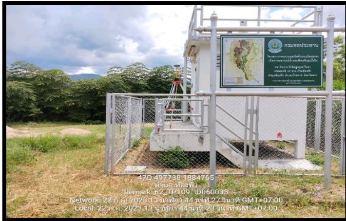
ทิสเหนือ