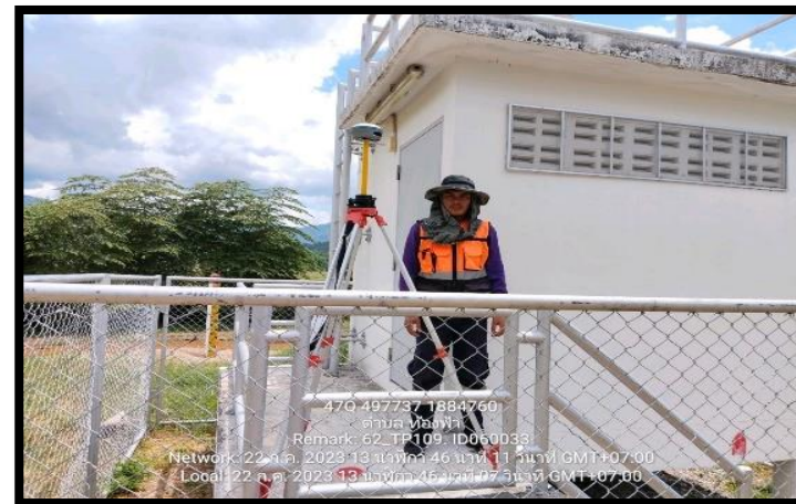
ทิสตะวันตก