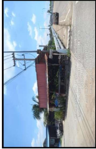
ทิศตะวันตก