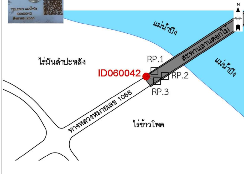
รูปที่ 1.3-23 รูปแสดงรายละเอียดหมายเหตุหลักฐาน ID060042

ID060042 เป็นหมายเหตุหลักฐานแผนที่ กรมชลประทาน สแตนเลสสี่เหลี่ยม ขนาด 8 x 8 ซม. ตรงกลางเป็นนอตหัวกลมรูปกากบาท ฝังอยู่บริเวณบนทางเท้ามุมสะพานหลานดอกไม้ ค่าพิกัดทางราบและค่าพิกัดทางตั้งได้จากการรังวัด STATIC