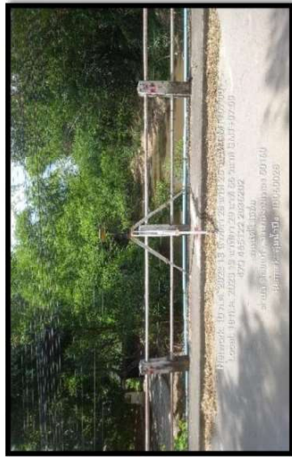
กีดหน้ามือ