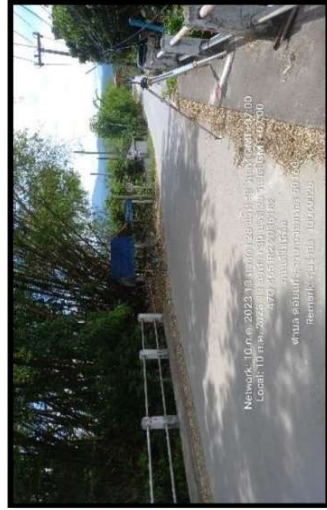
กีดหน้าตก