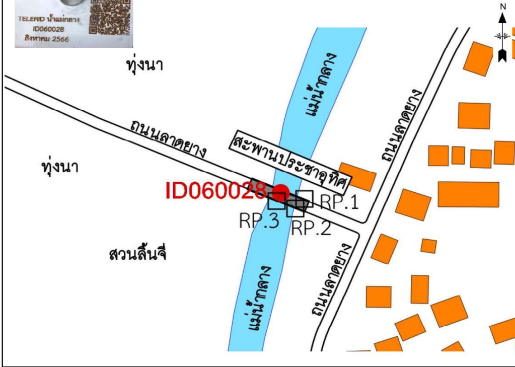
รูปที่ 1.3-16 รูปแสดงรายละเอียดหมายเหตุหลักฐาน ID060028

ID060028 เป็นหมายเหตุหลักฐานแผนที่ กรมชลประทาน สแตนเลสสี่เหลี่ยม ขนาด 8 x 8 ซม. ตรงกลางเป็นนอตหัวกลมรูปกากบาท ฝังอยู่บริเวณบนทางเท้าสะพานข้ามน้ำกลาง บ้านแม่กลาง ค่าพิกัดทางราบและค่าพิกัดทางตั้งได้จากการรังวัด STATIC