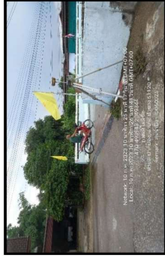
ทิวตะวันตก