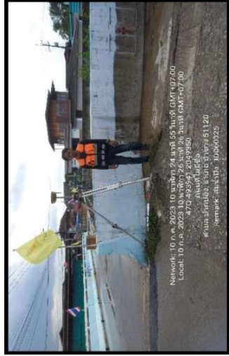
ทิวตะวันออก