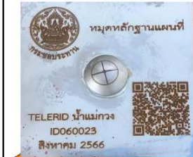
รูปที่ 1.3-12 รูปแสดงรายละเอียดหมายเหตุหลักฐาน ID060023