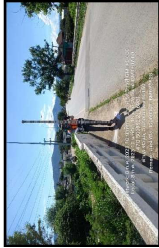
ทิศตะวันตก