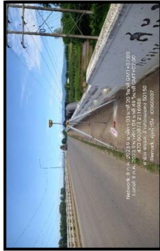
ทิศเหนือ