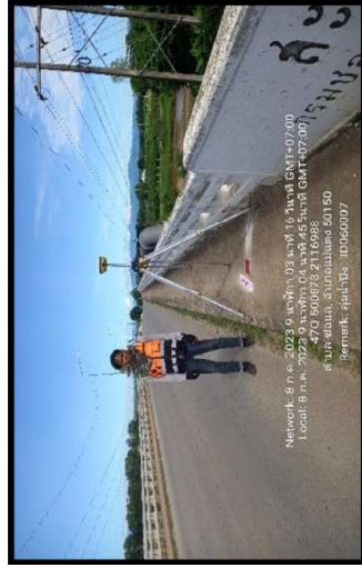
ทิศตะวันออก