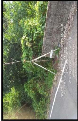
ทึทตะวันออก