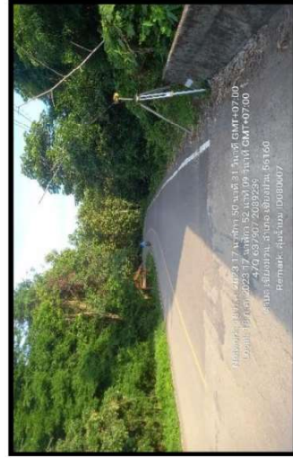
ทึทตะวันตก