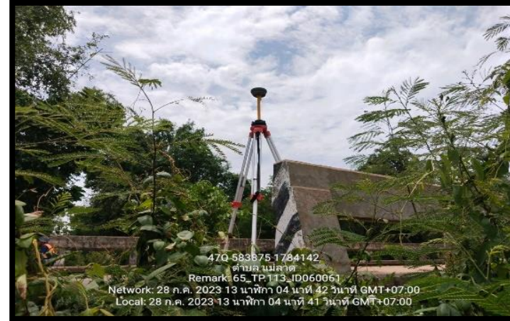
ทิสตะวันออก