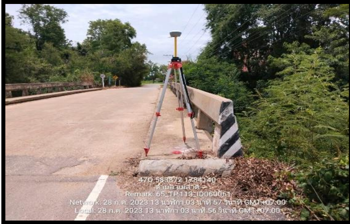
ทิสเหนือ