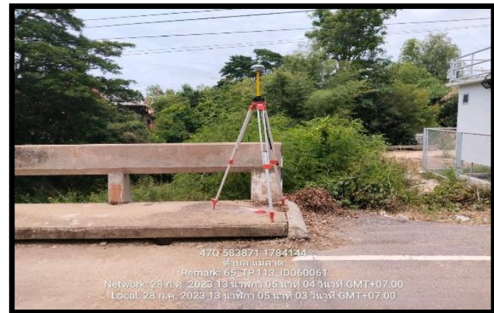
ทิสตะวันตก