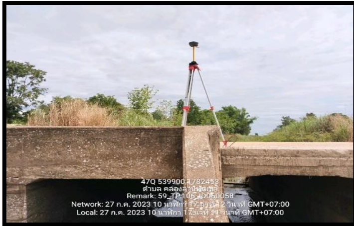
ทิสเหนือ