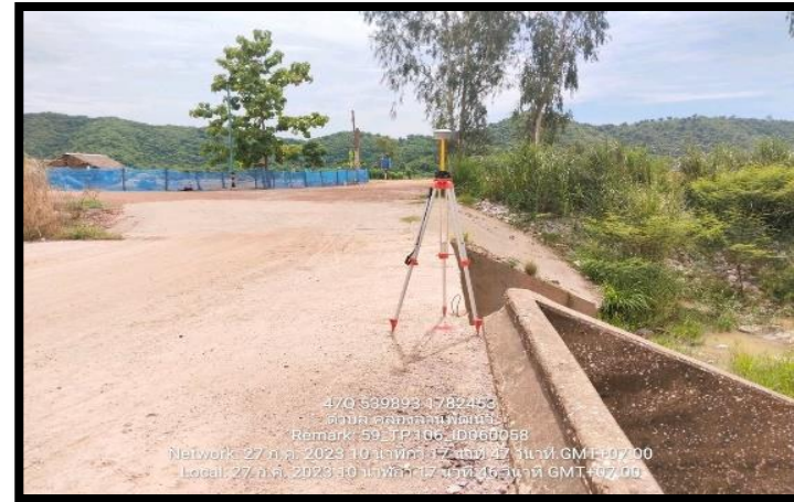
ทิสตะวันออก