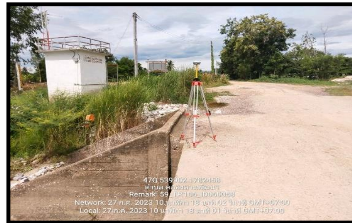
ทิสตะวันตก