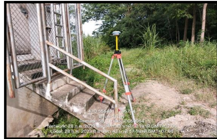
ทิศตะวันตก