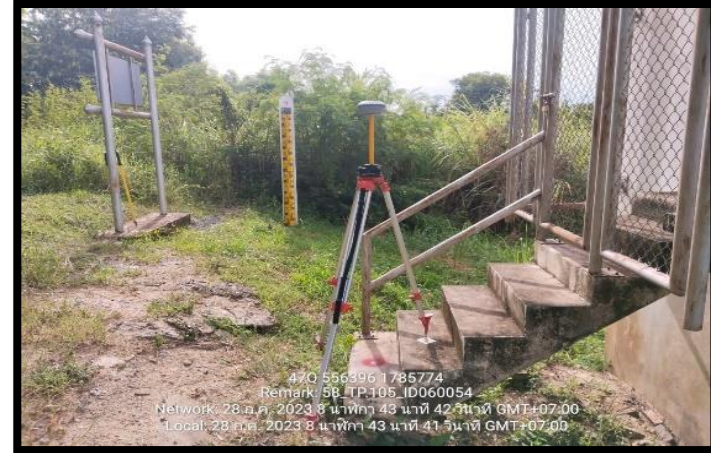
ทิศตะวันออก