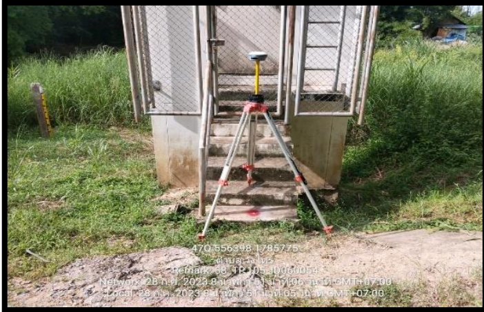
ทิศเหนือ