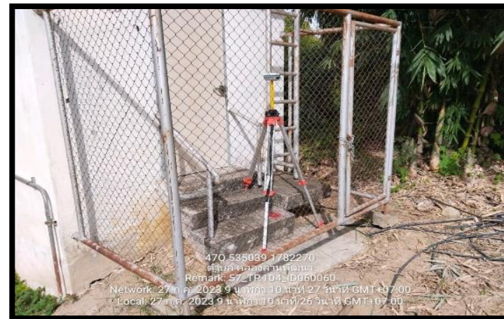
ทิสตะวันตก