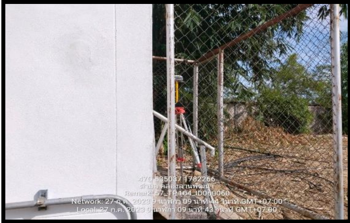
ทิสเหนือ