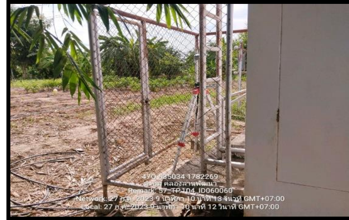
ทิสตะวันออก