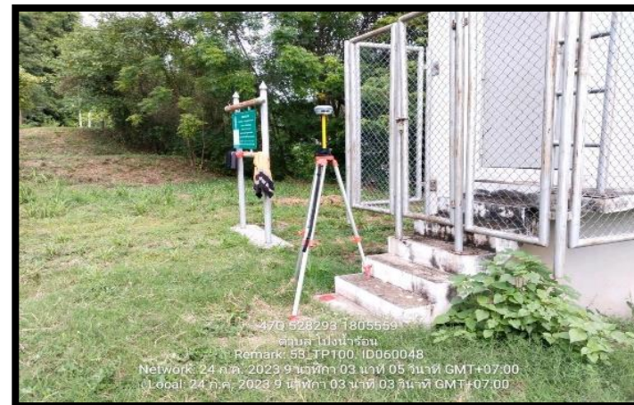
ทิศตะวันตก