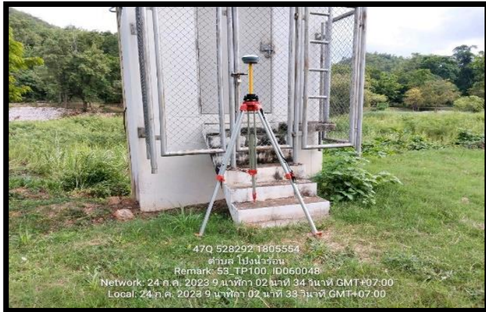
ทิศเหนือ