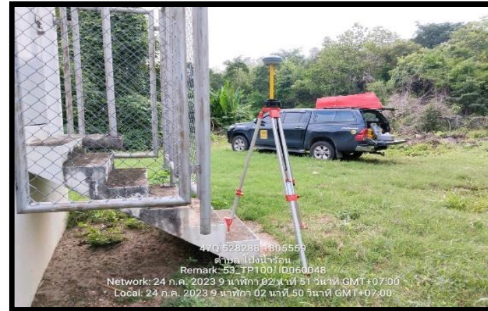
ทิศตะวันออก