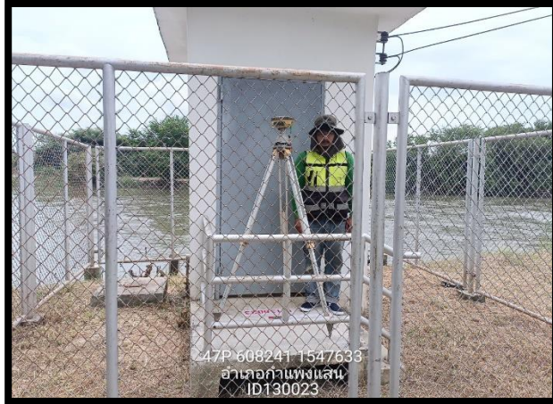
ทิสเหนือ