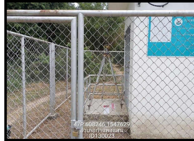
ทิสตะวันออก