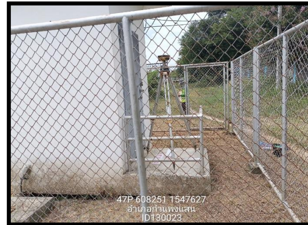
ทิสตะวันตก