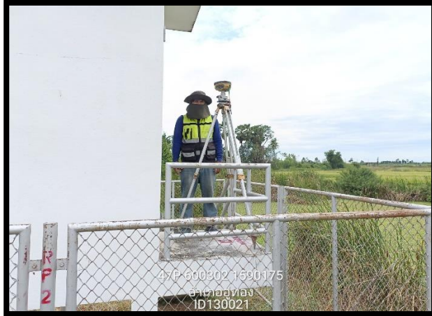
ทิศเหนือ