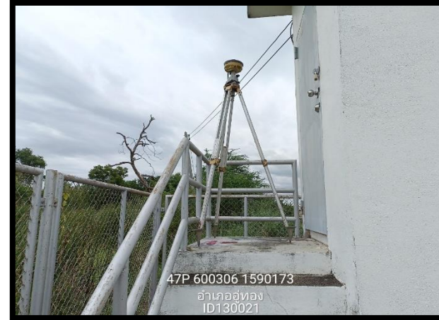
ทิศตะวันออก