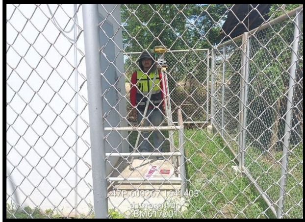
ทิศเหนือ