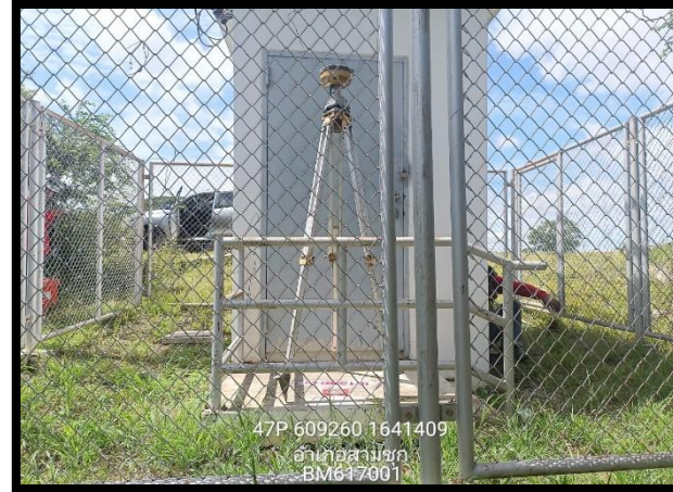
ทิศตะวันออก