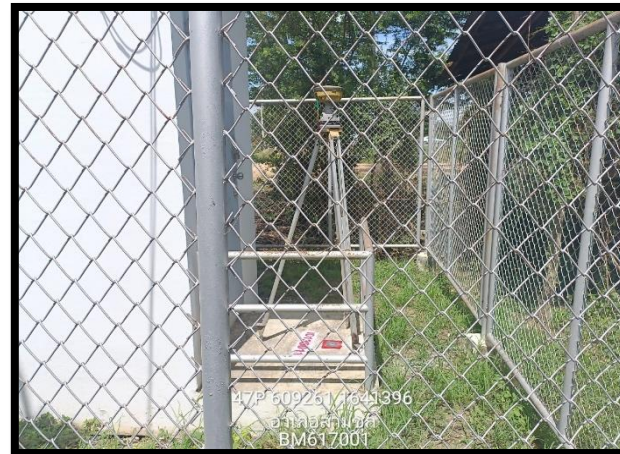
ทิศตะวันตก