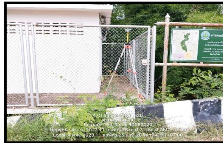
ทิสตะวันตก