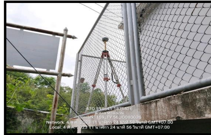
ทิสตะวันออก