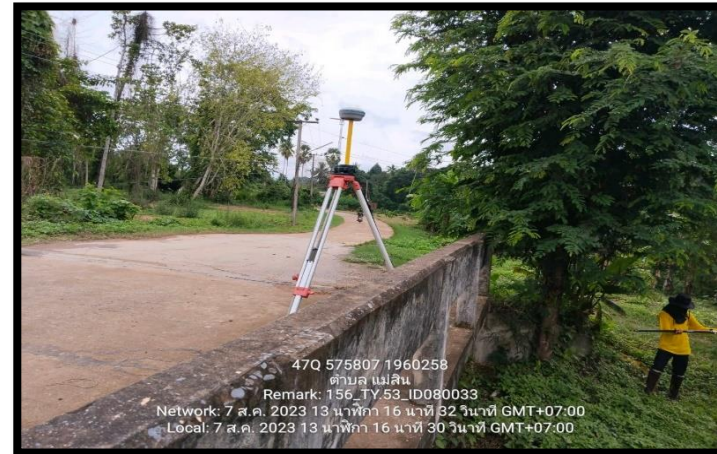
ทิสตะวันออก