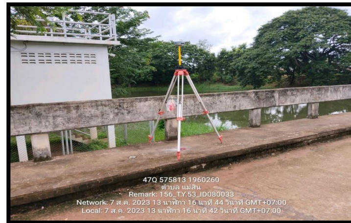
ทิสตะวันตก