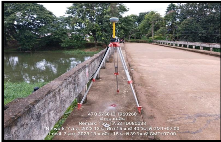
ทิสเหนือ