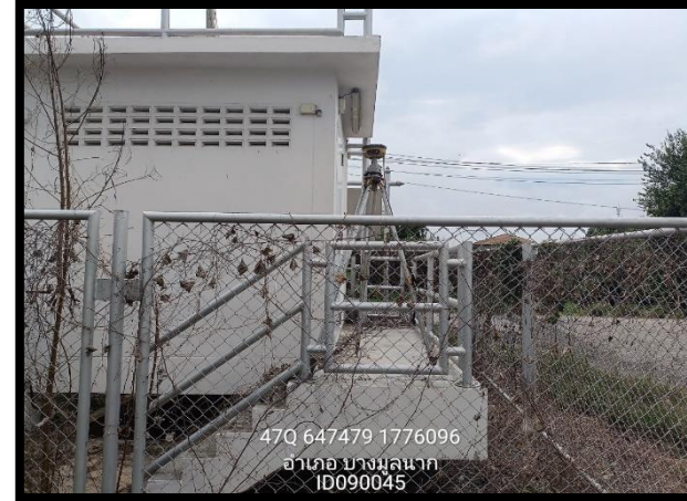
ทิศตะวันออก