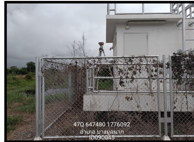
ทิศตะวันตก