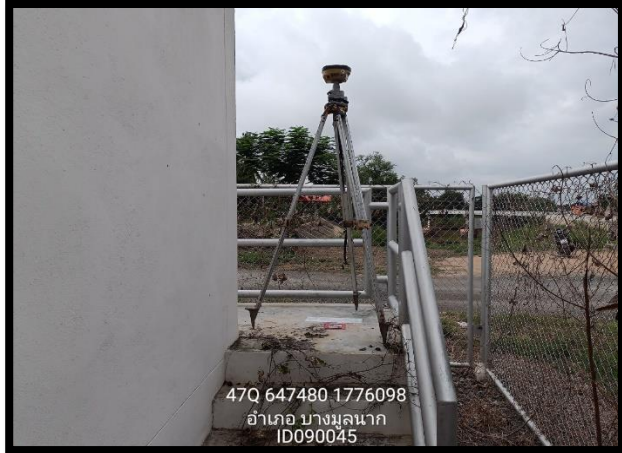
ทิศเหนือ