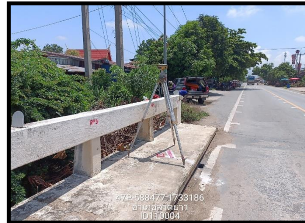
ทิศตะวันตก