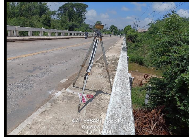
ทิศตะวันออก