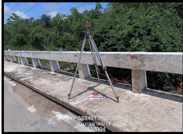
ทิศเหนือ