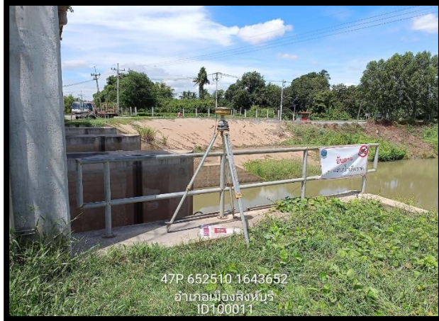
ทิสเหนือ