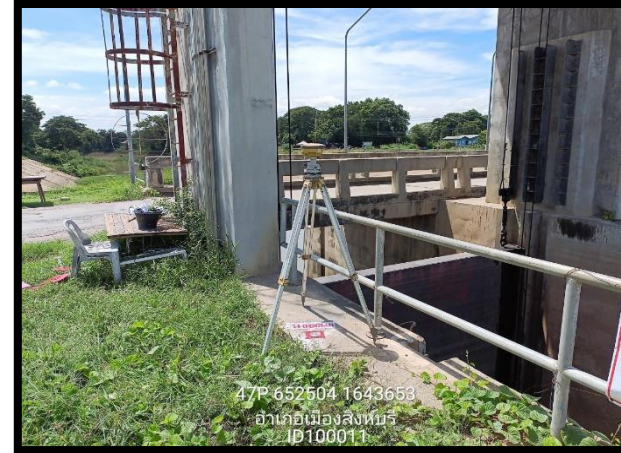
ทิสตะวันออก