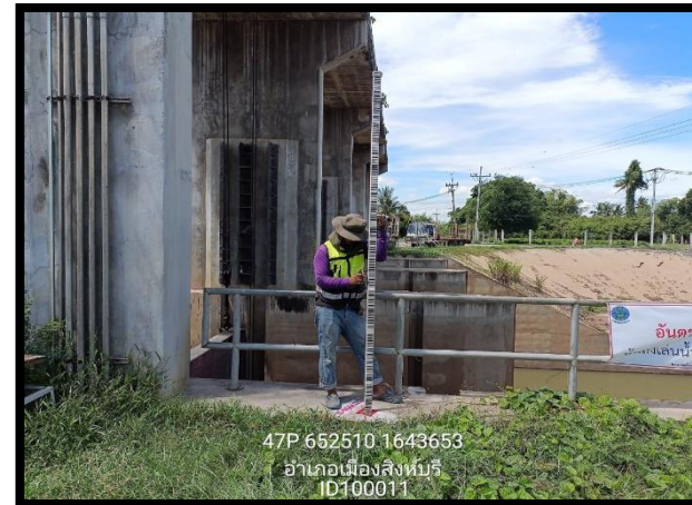
ทิสตะวันตก