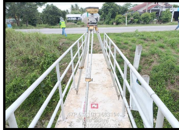
ทิสตะวันออก