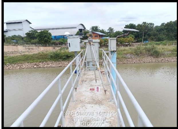
ทิสเหนือ