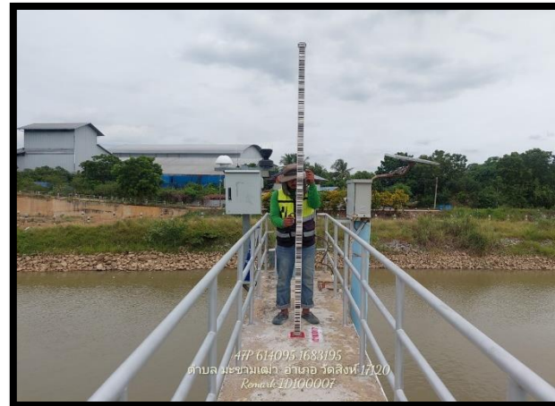
ทิสตะวันตก