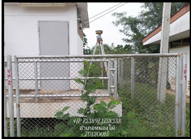
ทิสเหนือ