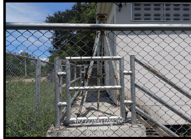
ทิศตะวันออก