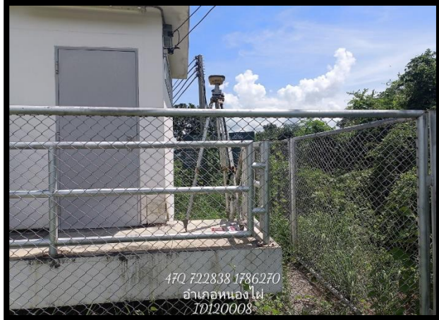
ทิศเหนือ