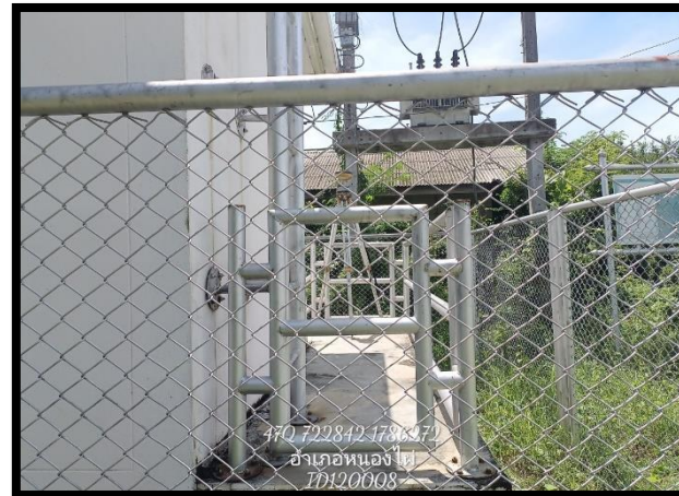
ทิศตะวันตก