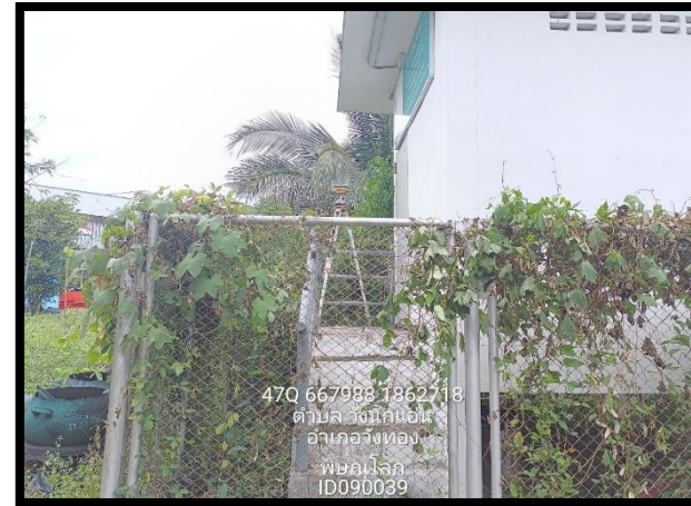
ทิศตะวันออก