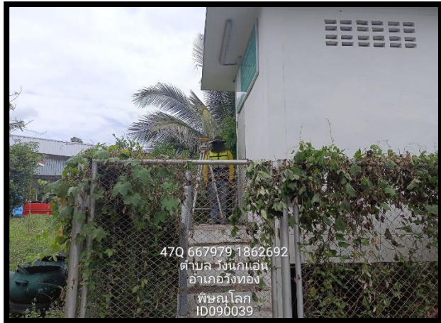
ทิศเหนือ