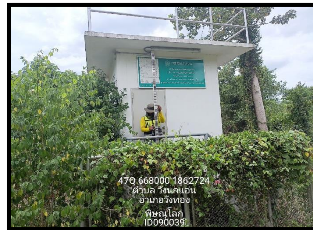
ทิศตะวันตก