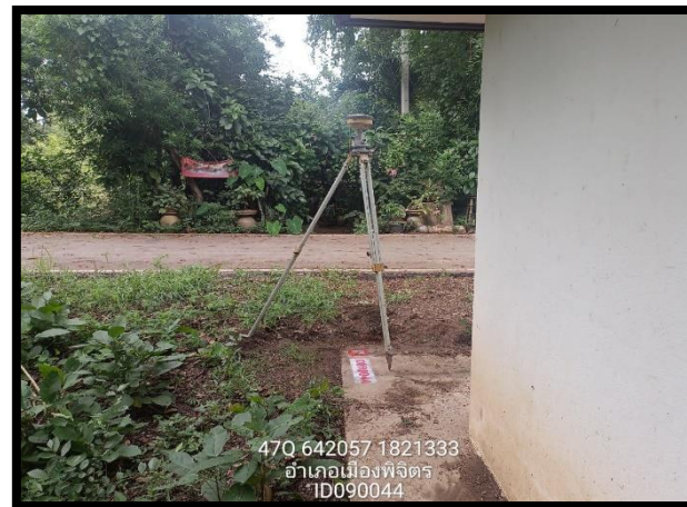
ทิสตะวันตก