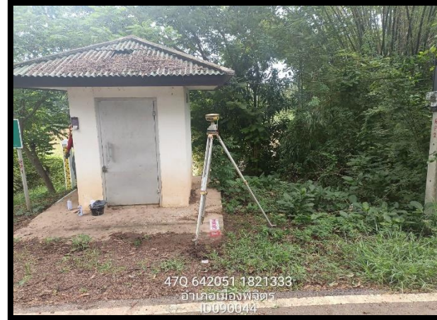
ทิสตะวันออก