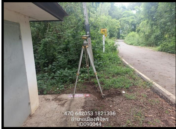
ทิสเหนือ