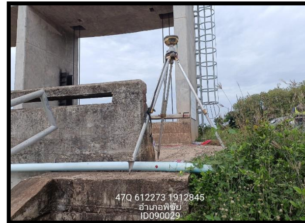
ทิสตะวันตก