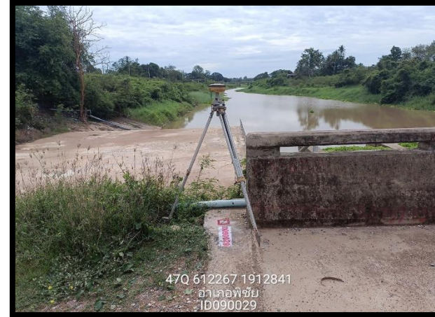
ทิสตะวันออก