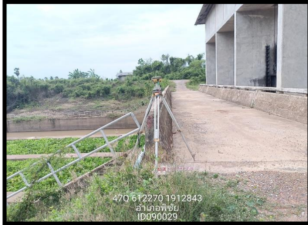
ทิสเหนือ