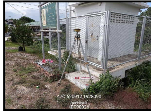
ทิสตะวันออก