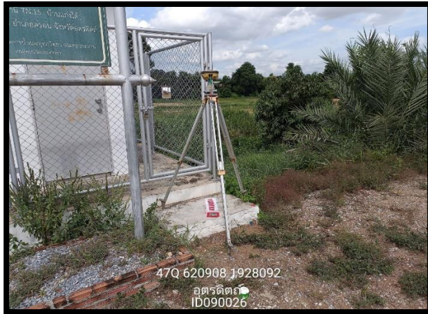
ทิสเหนือ