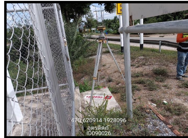
ทิสตะวันตก