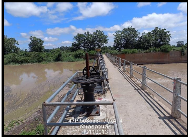
ทิสเหนือ