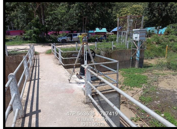
ทิสตะวันออก