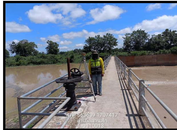
ทิสตะวันตก