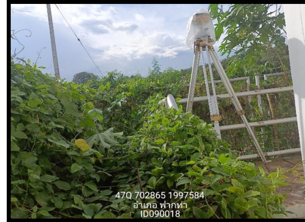
ทิศตะวันออก