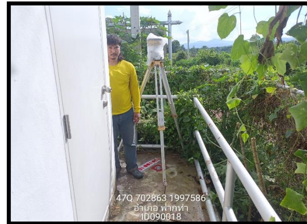
ทิศตะวันตก