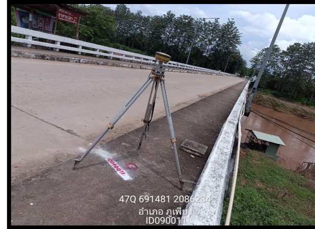
ทิศตะวันออก