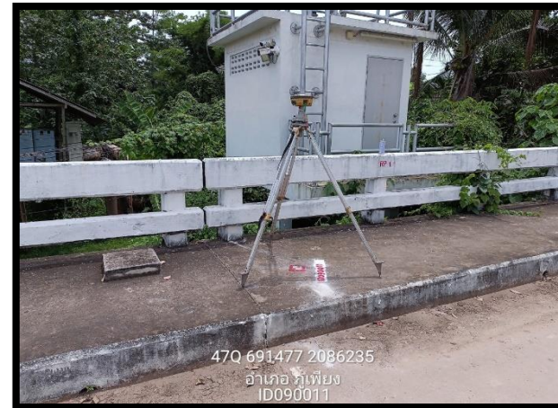
ทิศตะวันตก