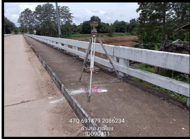
ทิศเหนือ