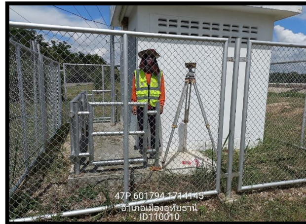
ทิศตะวันตก