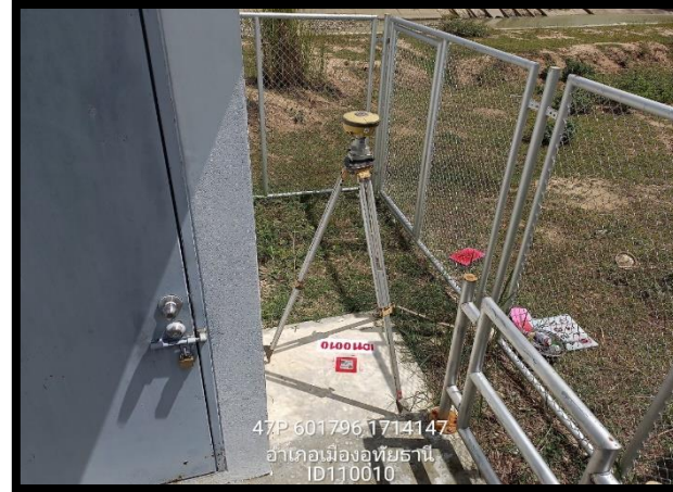
ทิศตะวันออก