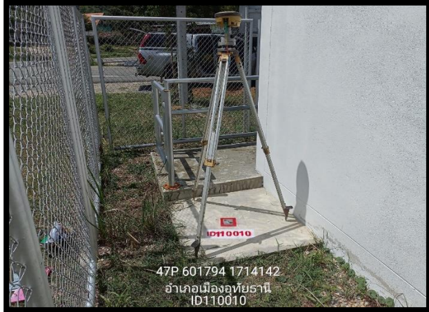
ทิศเหนือ