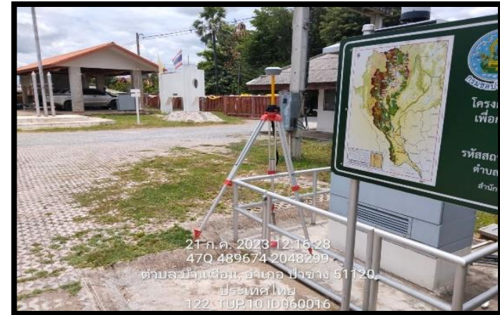
ทิศตะวันออก