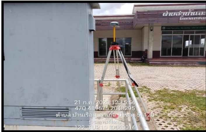
ทิศเหนือ