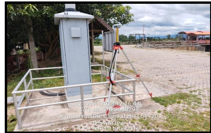
ทิศตะวันตก