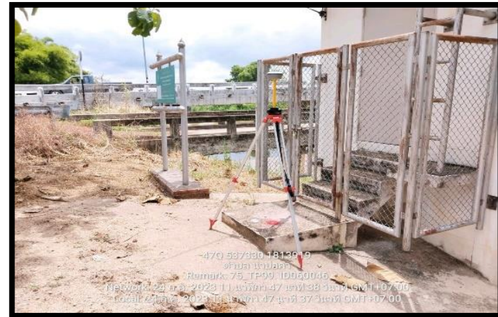
ทิสตะวันตก