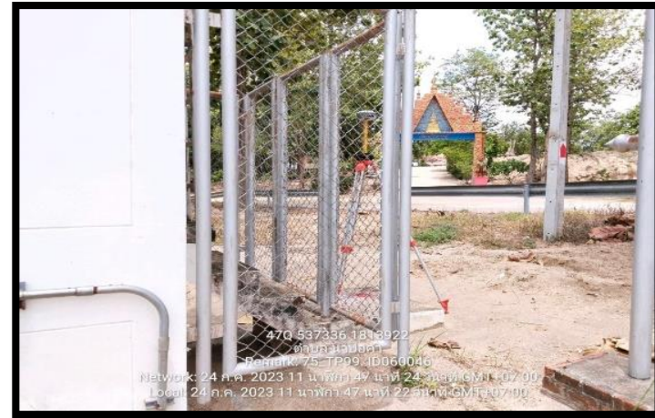
ทิสตะวันออก