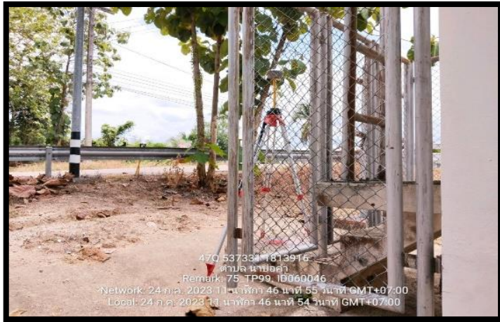
ทิสเหนือ