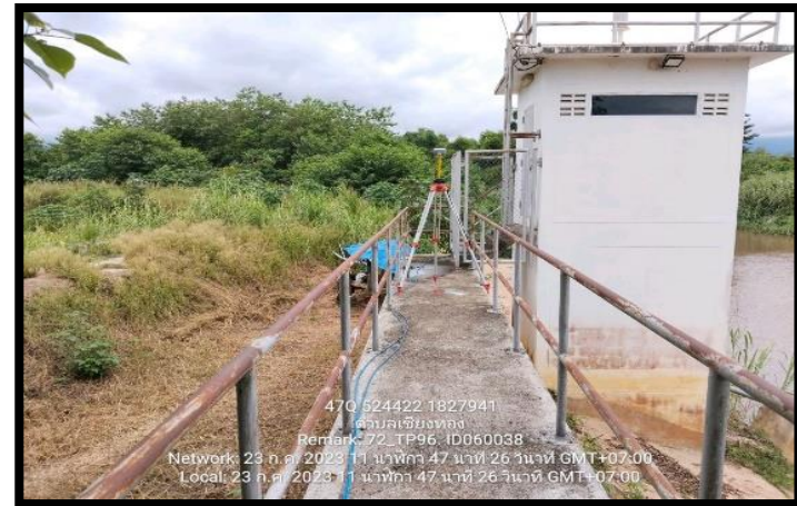
ทิสตะวันตก