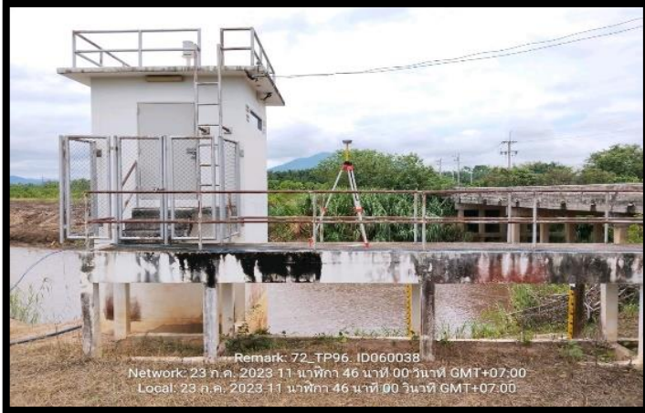
ทิสเหนือ