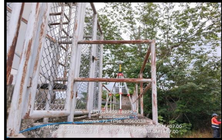
ทิสตะวันออก