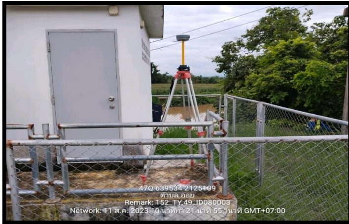
ทิสเหนือ