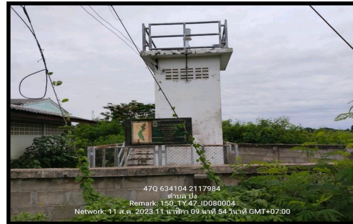
ทิสตะวันตก