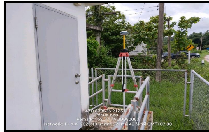
ทิสตะวันออก