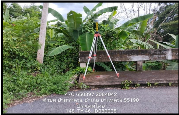
ทิสเหนือ