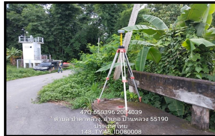
ทิสตะวันออก