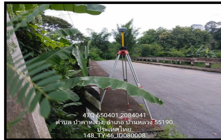
ทิสตะวันตก