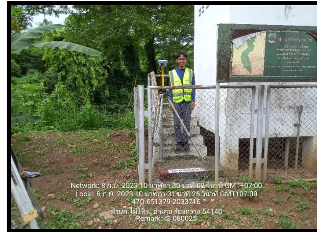
ทิศตะวันออก