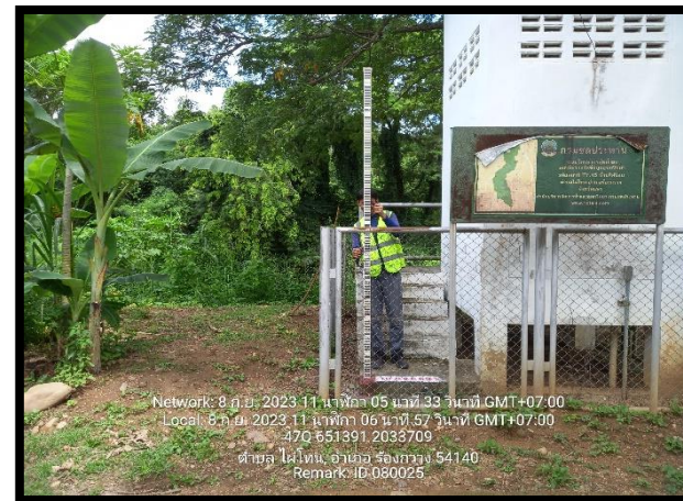
ทิศตะวันตก