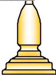
วัดทับเต๋อ