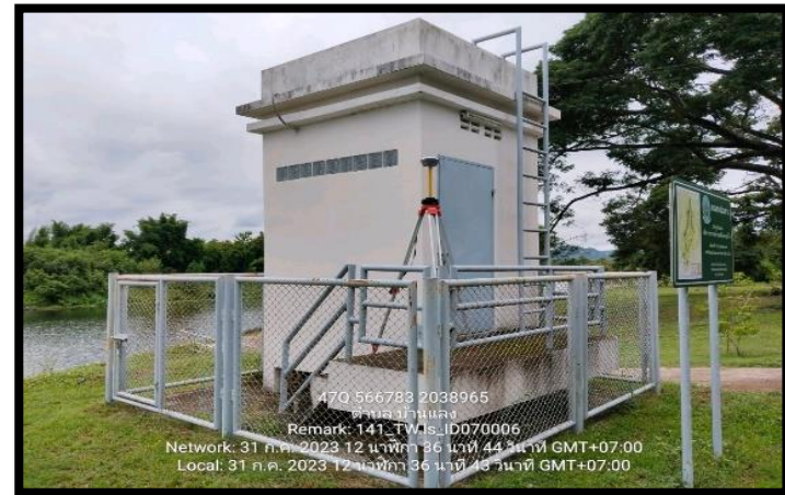
ทิศตะวันตก