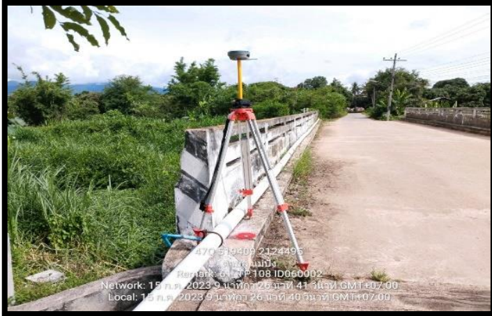
ทิสเหนือ