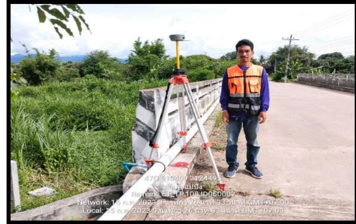
ทิสตะวันออก