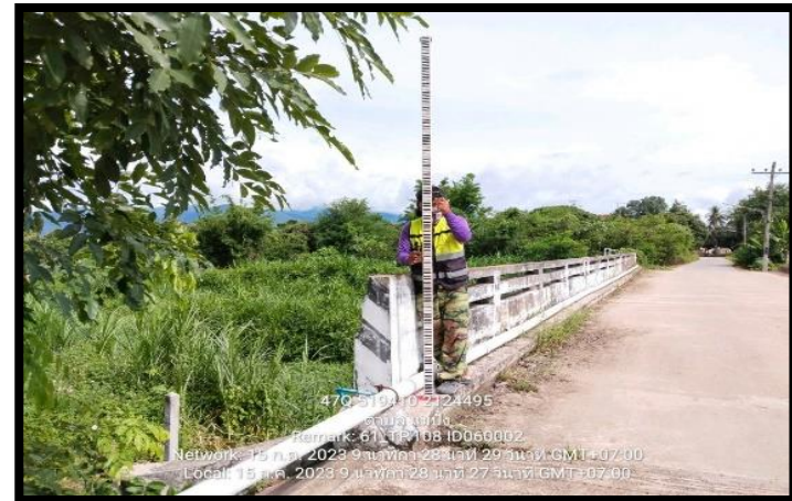
ทิสตะวันตก