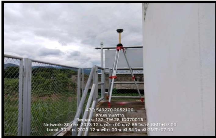
ทิสเหนือ