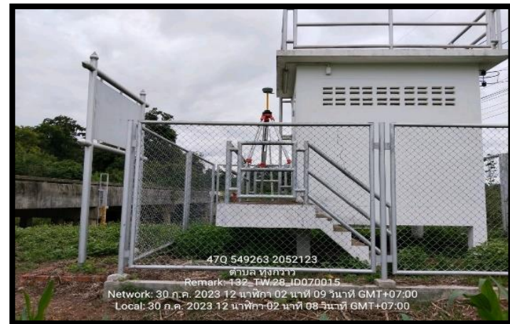
ทิสตะวันตก