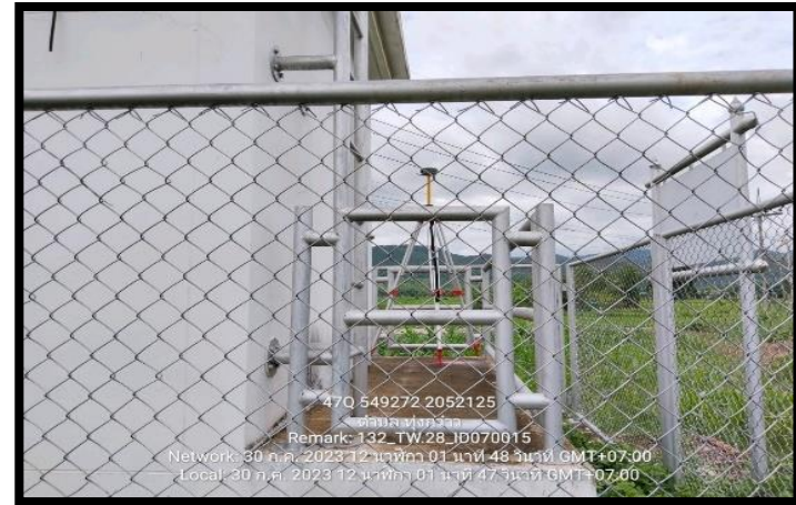
ทิสตะวันออก