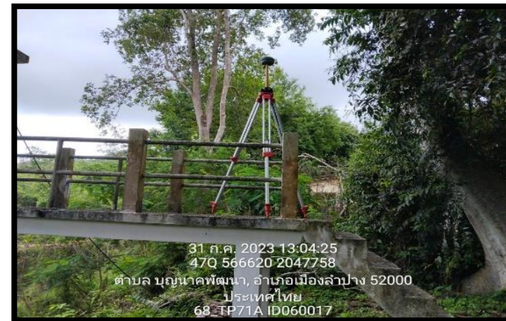
ทิสตะวันตก