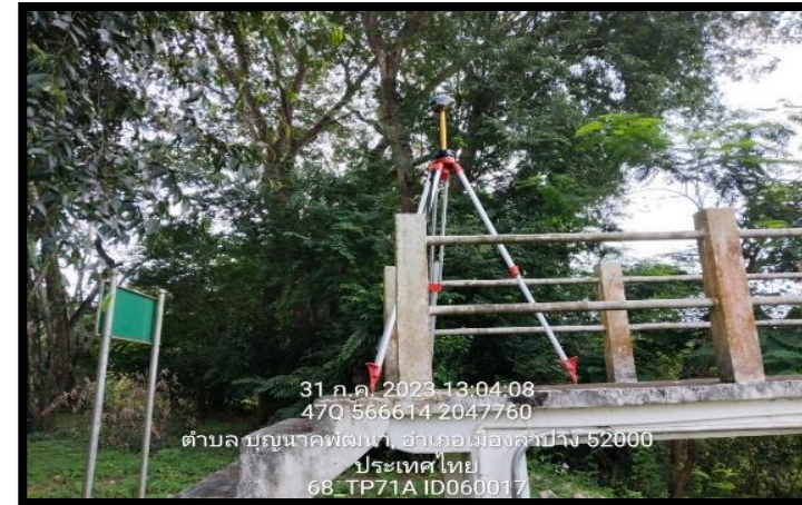
ทิสตะวันออก