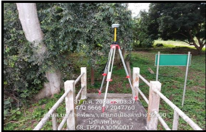
ทิสเหนือ